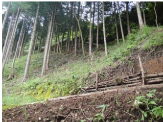
土層強度検査棒で鉄根打設の必要な箇所を抽出