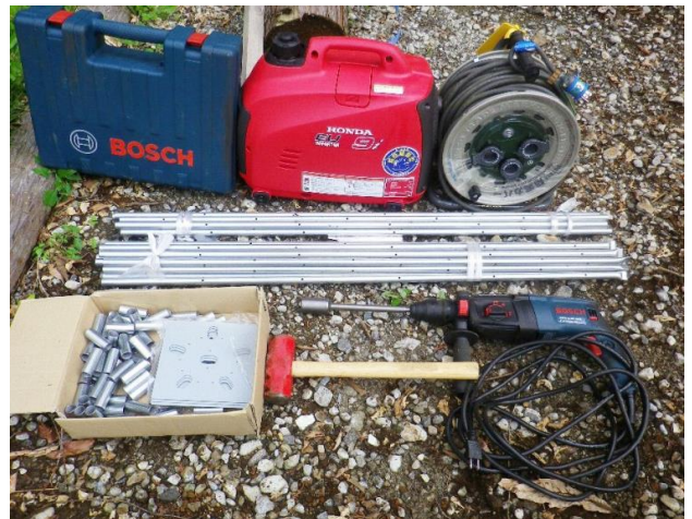
鉄根打設のための道具一式