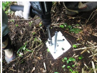
結束盤を設置。必要に応じて鉄根を追加。