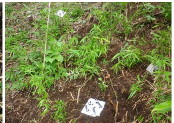
鉄根打設後の斜面